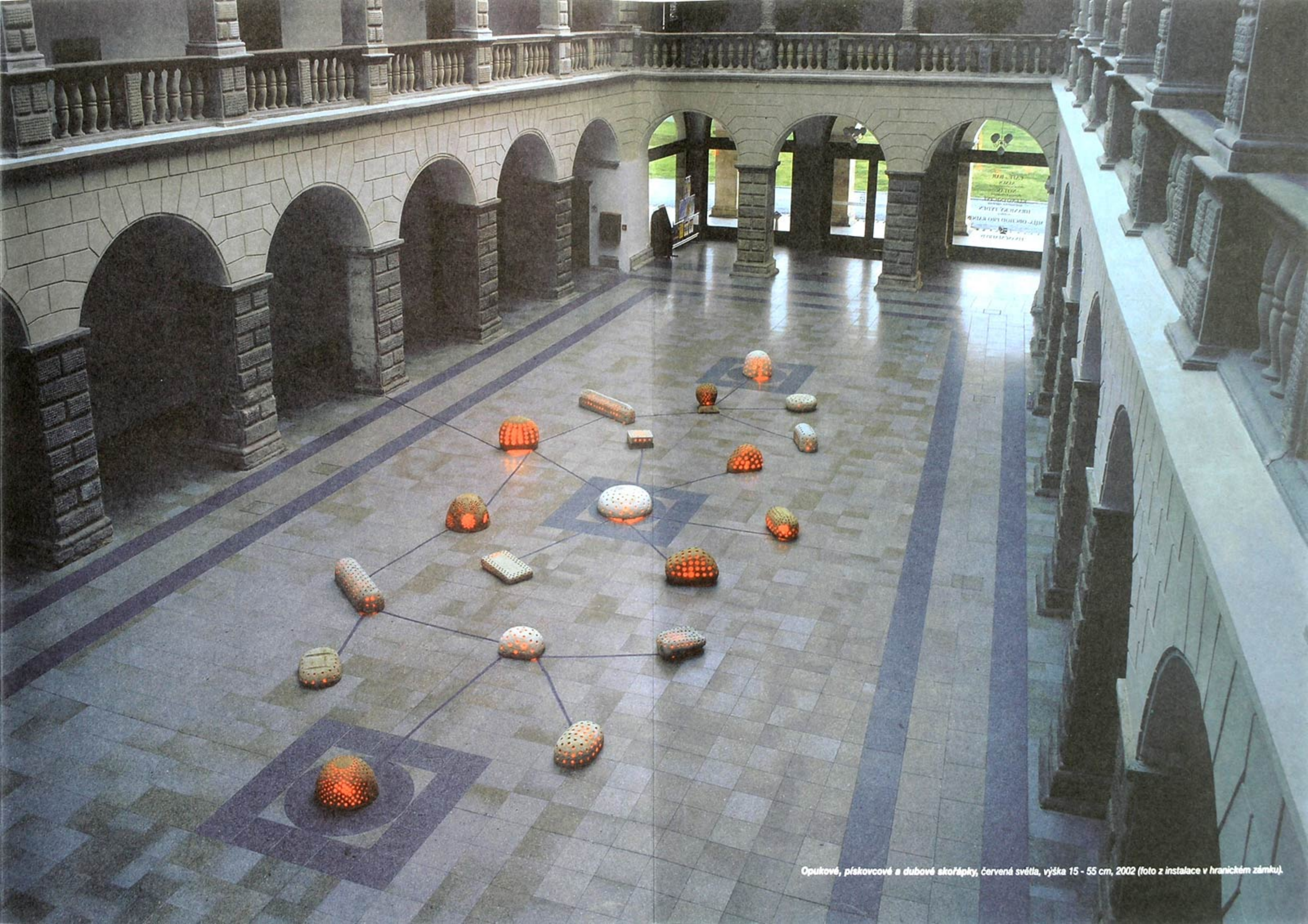
Opukové, pískovcové a dubové skořápky, červená světla, výška 15 - 55 cm, 2002 (foto z instalace v hranicím zámku).