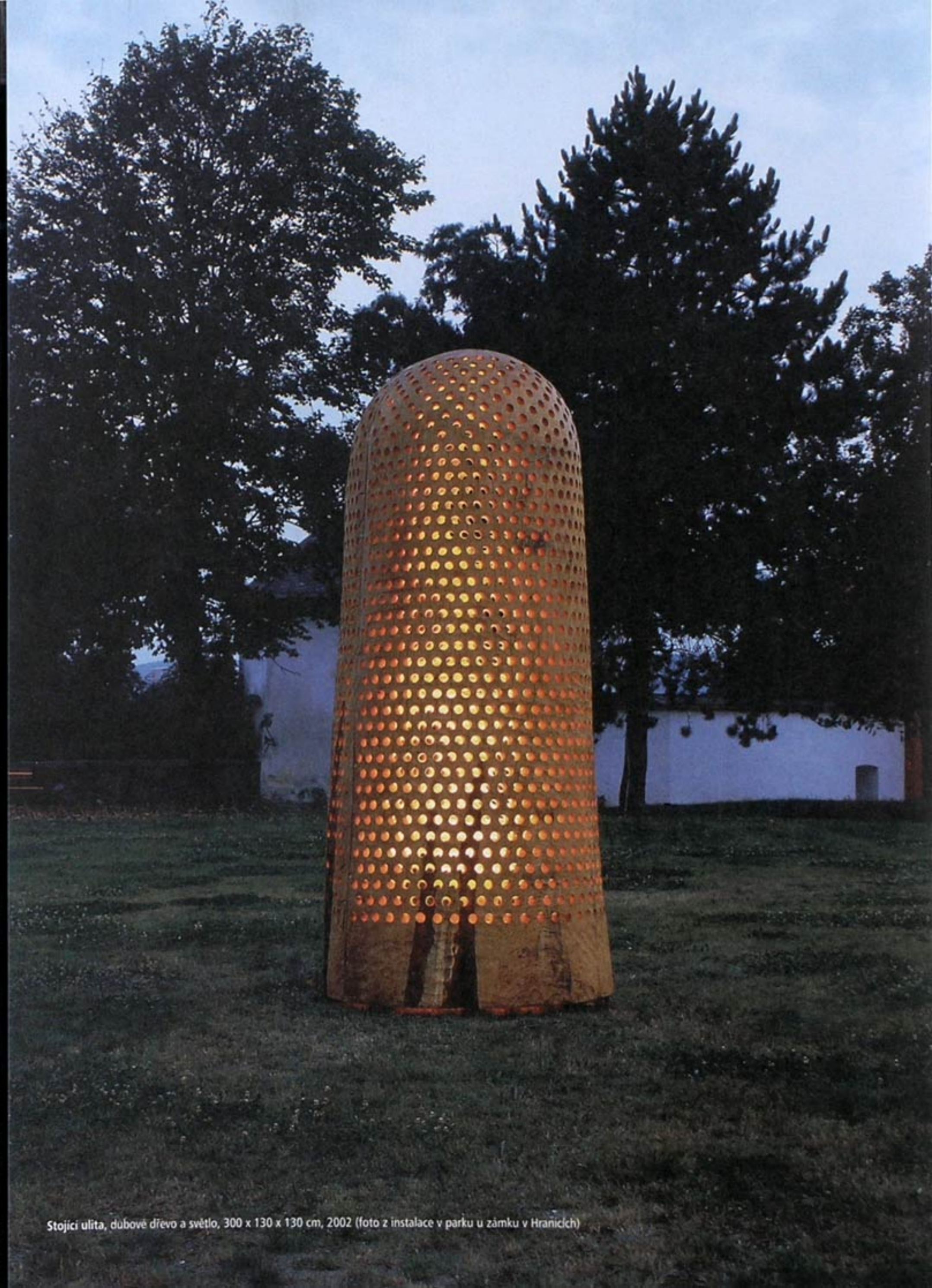
Stojící ulita, dubové dřevo a světlo, 300 x 130 x 130 cm, 2002 (foto z instalace v parku u zámku v Hranicích)