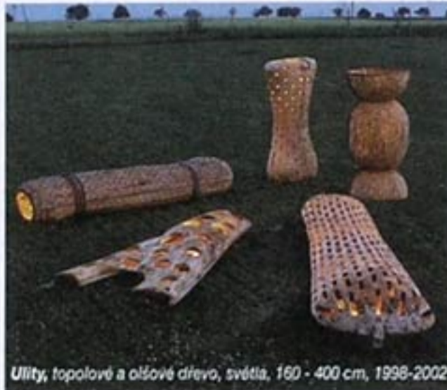
Ulity, topolové a olšové dřevo, světla, 160 - 400 cm, 1998-2002